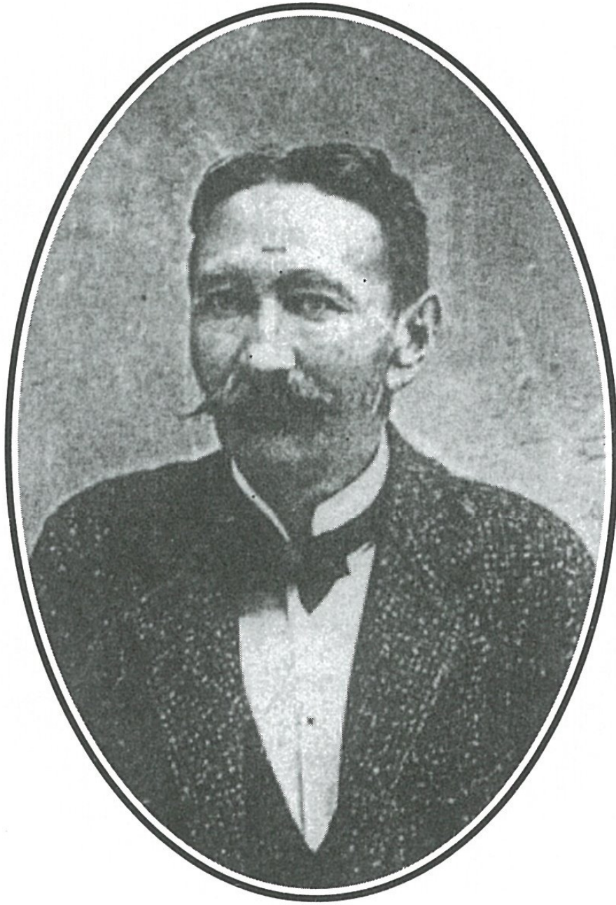
Petrovay György (1845–1916)